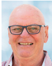
Benno Fehlmann Restauration